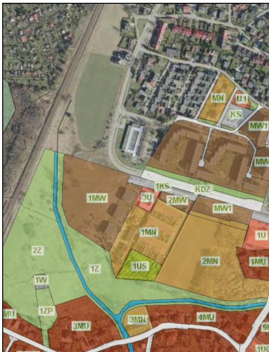
Rysunek 1 Przeznaczenia terenów na podstawie obowiązującego mpzp na podstawie geoportal.gov