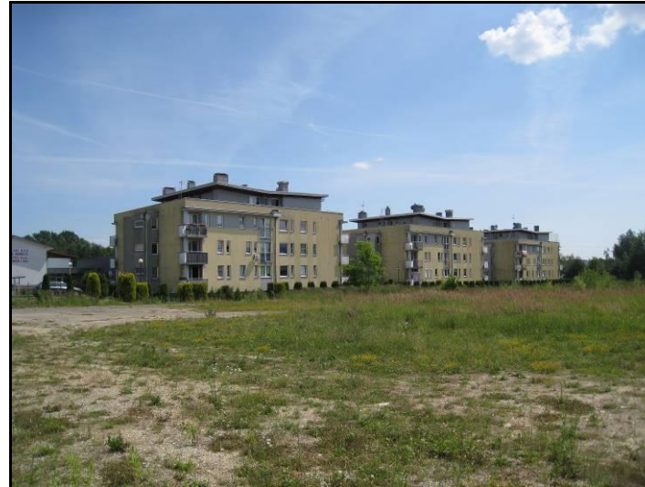
Fot. 4 Zabudowa wielorodzinna w części południowo-wschodniej