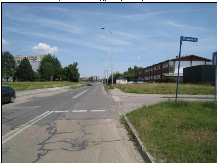
Fot. 2 Ul. Jaśkowska poza wschodnią granicą terenu, widok w kierunku wschodnim