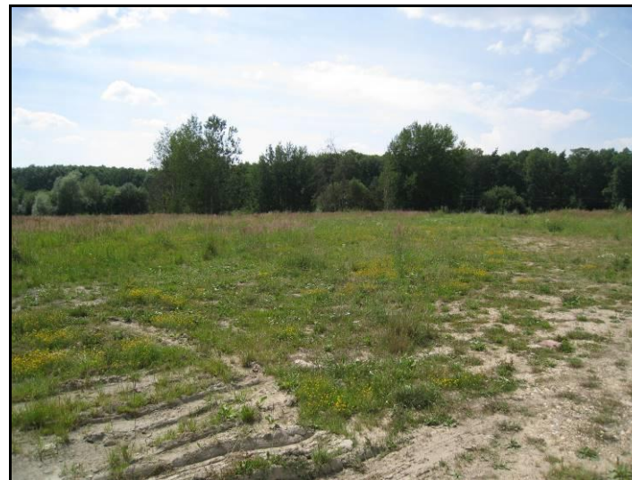
Fot. 3 Nieużytki w części południowej, widok w kierunku południowo-zachodnim