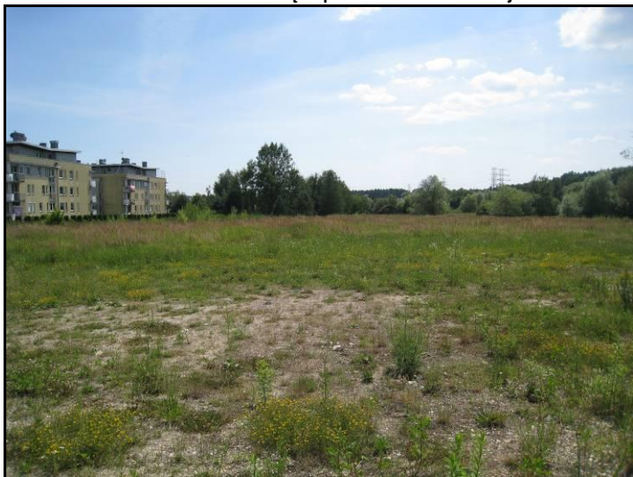
Fot. 6 Widok na nieużytki w części południowej