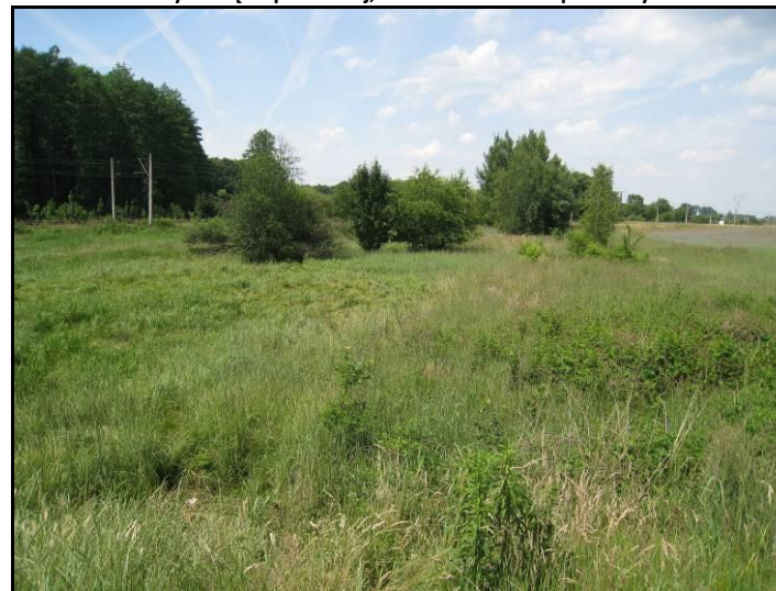
Fot. 8 Dolinka cieku bez nazwy poza zachodnią granicą terenu