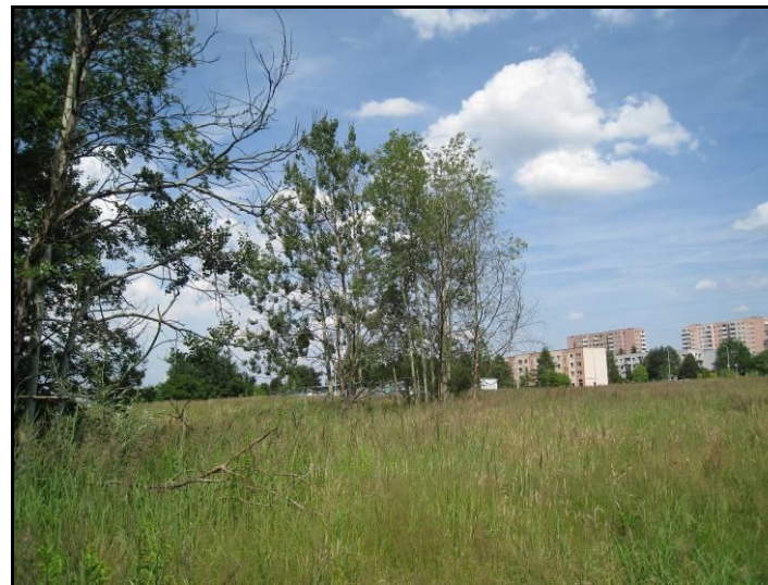
Fot. 11 Nieużytki w południowo-zachodniej części terenu