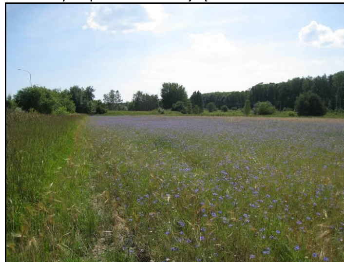
Fot. 12 Tereny rolne w północnej części terenu