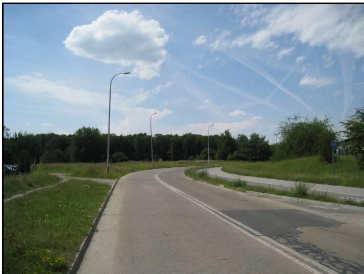
Fot. 1 Ul. Jaśkowska poza wschodnią granicą terenu, widok w kierunku zachodnim