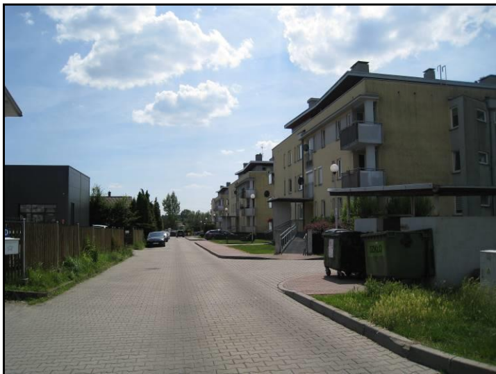
Fot. 5 Zabudowa wielorodzinna w części południowo-wschodniej