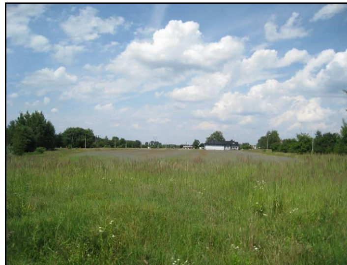
Fot. 7 Teren rolny w części północnej, widok w kierunku północnym